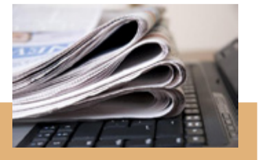
3 may Beynəlxalq Mətbuat və Söz Azadlığı Günüdür