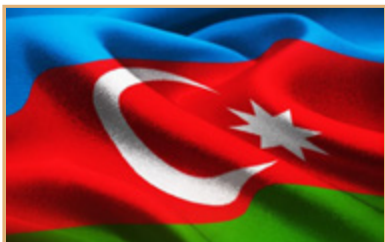
Fərqanə Qafarzadə Yaşa, yaşa, çox yaşa, ey şanlı Azərbaycan!