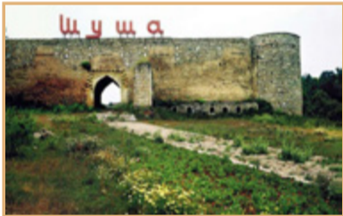
Qarabağın incisi Şuşa